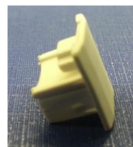
Exemplo do tampa de proteção

OBSERVAÇÃO: ORIENTE SEMPRE O CLIENTE A NÃO RETIRAR ESTA "TAMPA DE PROTEÇÃO" E INDIQUE QUE A LINHA TELEFÔNICA ESTARÁ CADASTRADA OBRIGATORIAMENTE NA PORTA TEL1, CONFORME IMAGEM ACIMA.